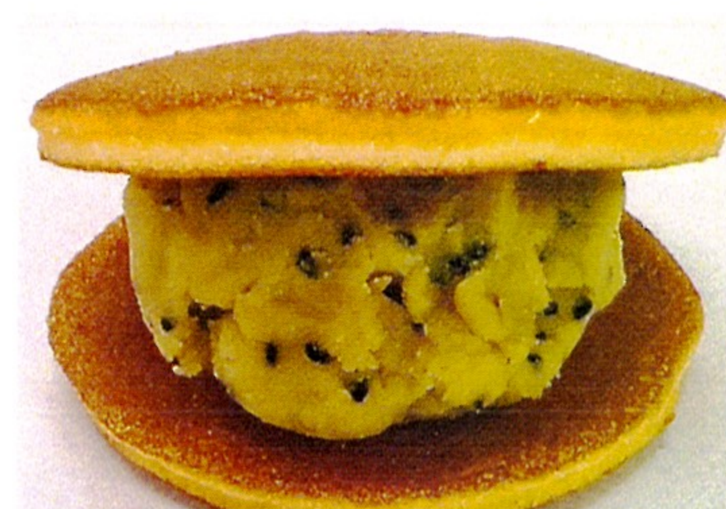
黒ごまおさつどら 280円 黒ごま+さつまいも