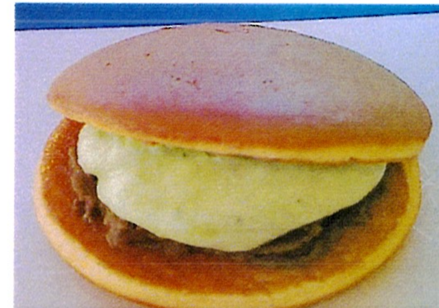
抹茶生どら 280円 抹茶生クリーム+甘酒あんこ