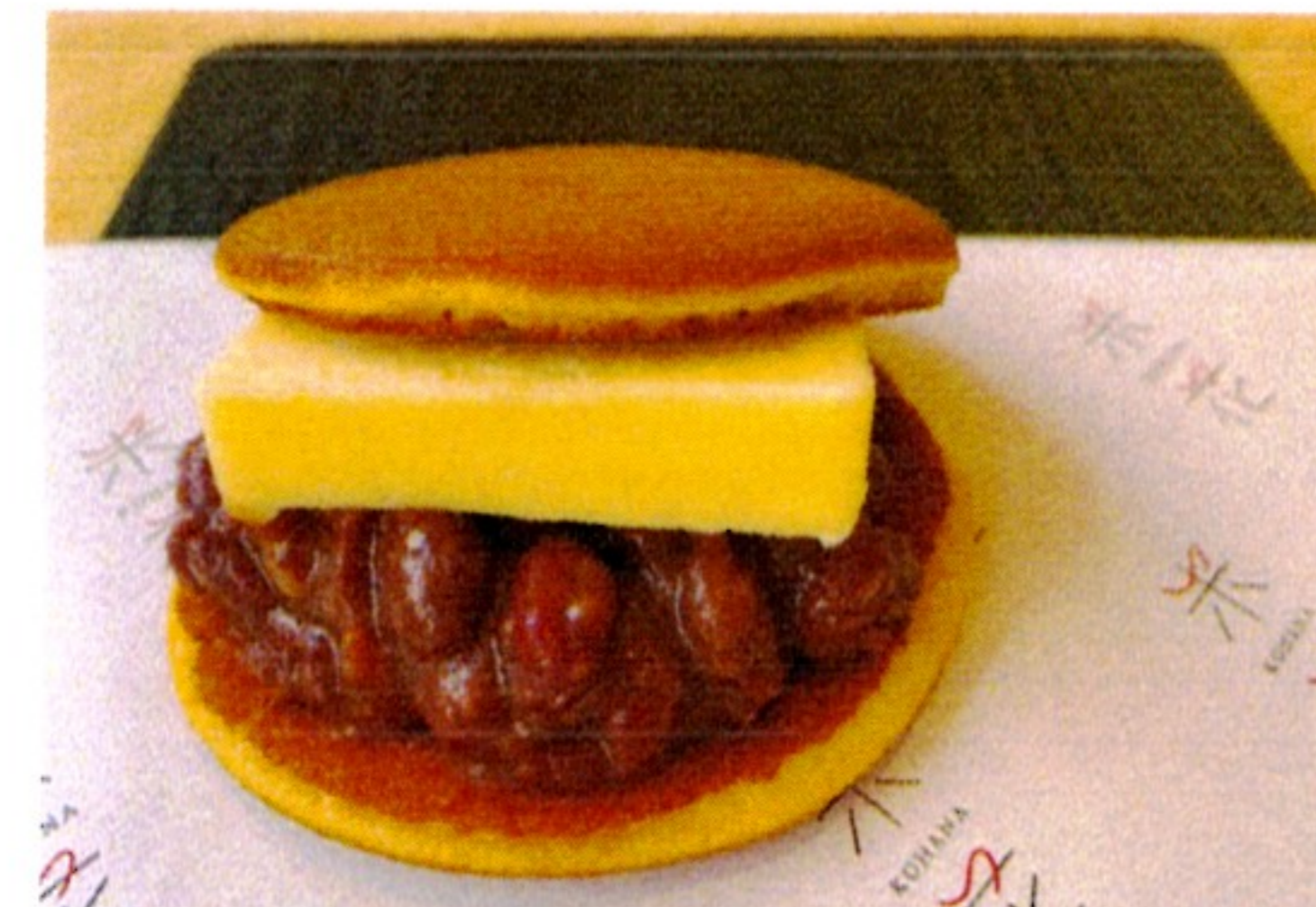
あんバター 280円 バター+甘酒あんこ