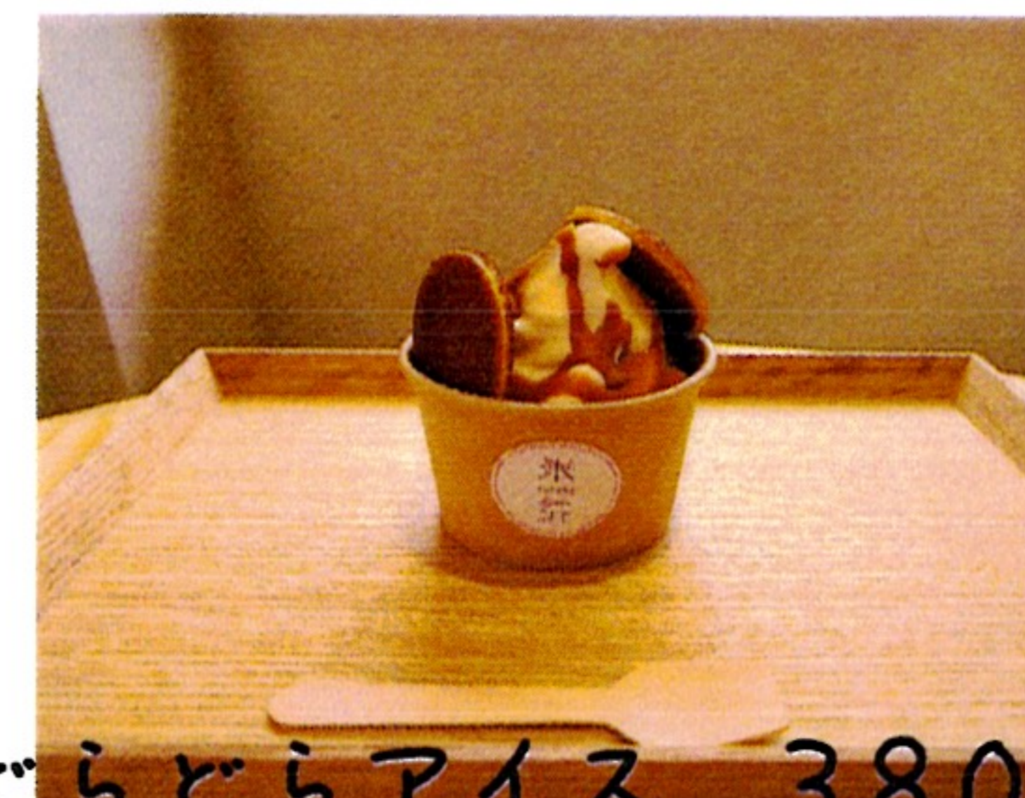
どらどらアイス 380円 ストロベリー/チョコ/キャラメル 夏季限定