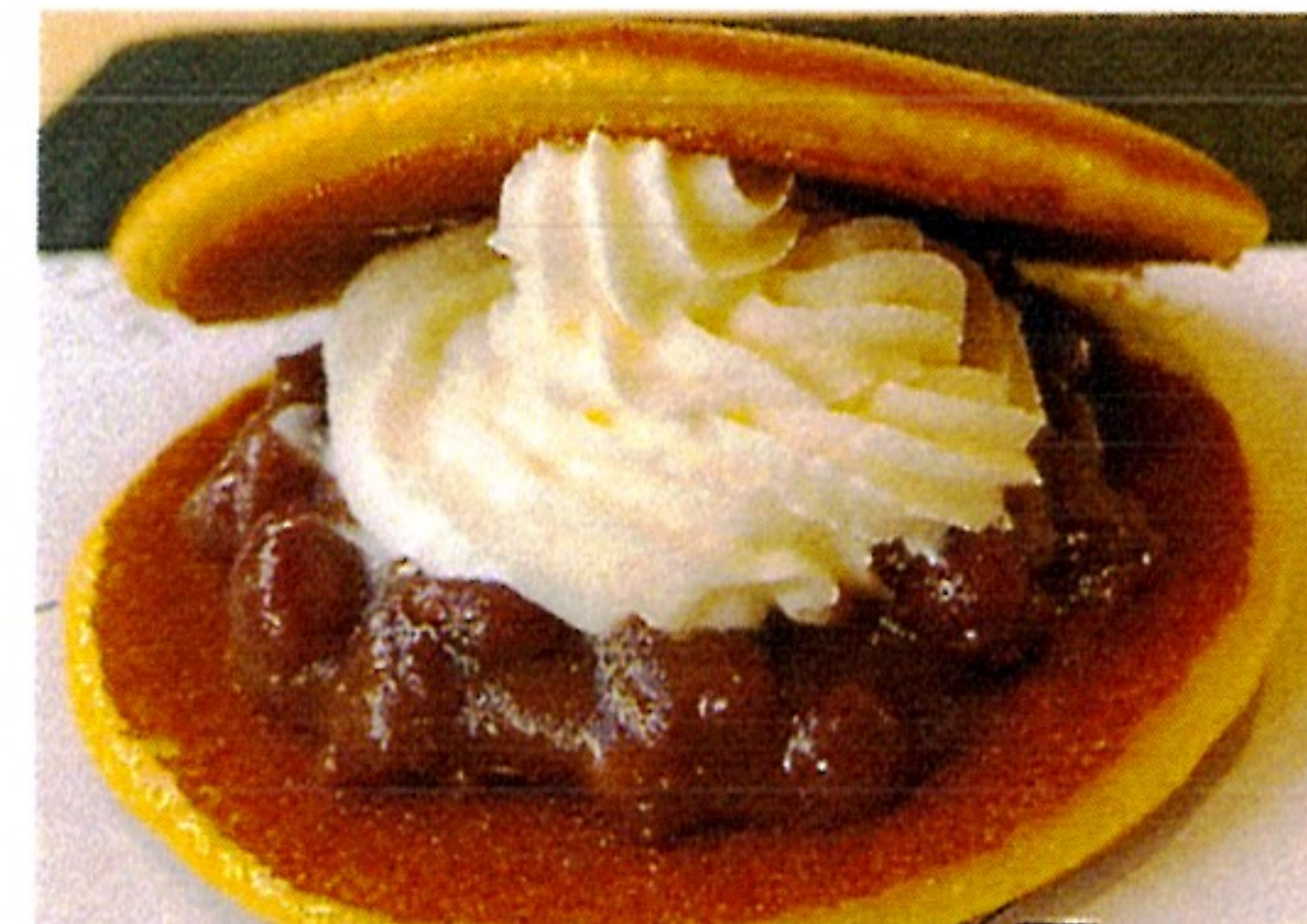
生どら 250円 生クリーム+甘酒あんこ