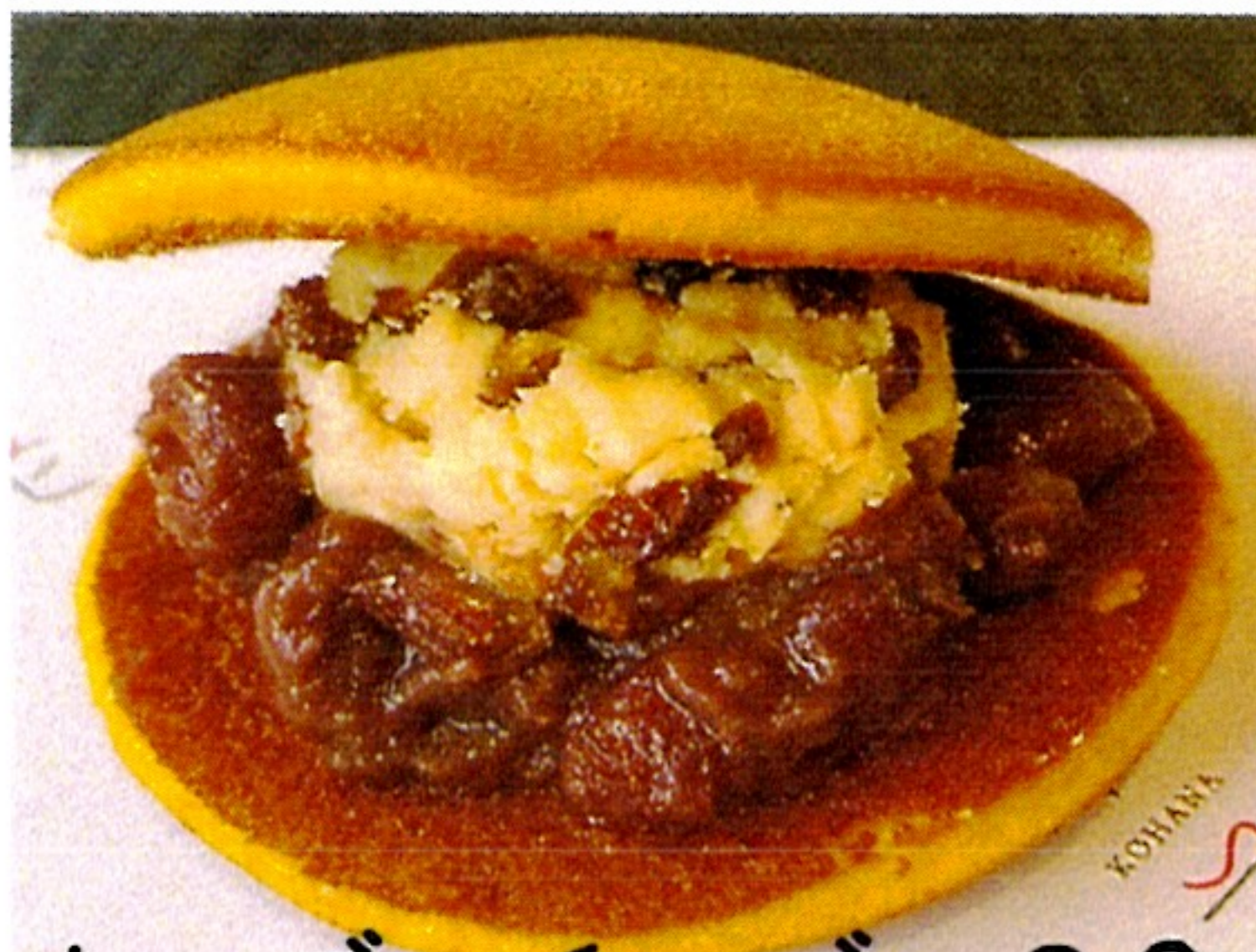
ラムレーズンチーズ 280円 ラムレーズン+クリームチーズ+甘酒あんこ