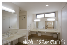
車椅子対応洗面台