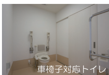
車椅子対応トイレ