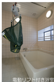
電動リフト付き浴室